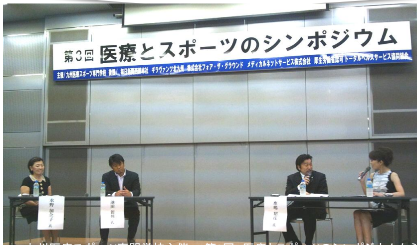
九州医療スポーツ専門学校主催 第3回 医療とスポーツのシンポジウムから

うい思元一氣い十のだ張のも調しき かるっ気なが。分身とっ皆あをい、夏 ？のてなぜ無疲気体思たさり崩季まも ワでいの、くれをのい疲んまし節だ終 ンはるだ水なが使体まれにすやでまわ ポなスル嶋りたっ調すのお。すすだり イイタうはままで管。たいスイ。残に ンでツ？一するく理自までタ季特暑近 トしフ一。年。とだに分るもツ節にがづ アよもと中 元さも達頃頑フで体厳