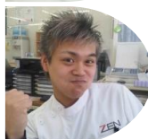
登 裕也 小芝院