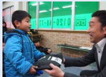
合馬小学校 6年生 お別れバスケット ボールイベント 3月20日

保護者を含めた6年生送別会で、ラダートレーニング、基本の走り方バランスディスクを使った運動などを行いました。