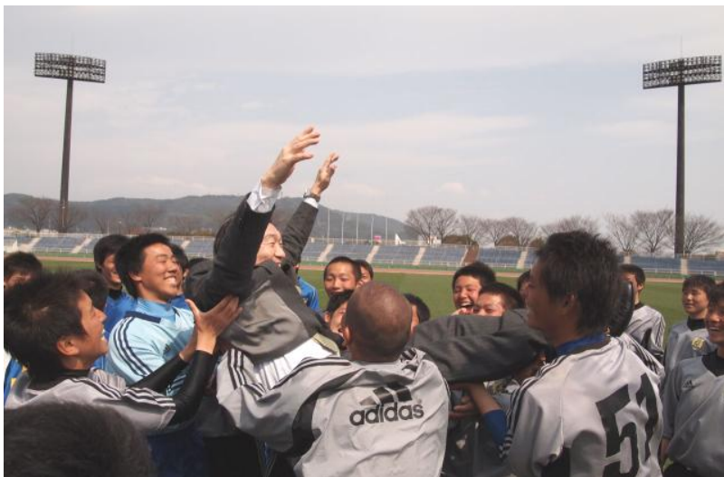
全79チームが参加！！ 第26回 北九州高校サッカーフェスティバル 2012 九州医療スポーツ専門学校杯 3月28日～30日

水嶋 昭彦 リサる 勇チとジてい動一なるし生た自 続|メ私気ヤです新るく動り事なき事分 けビデ達をしあるし事事物まにい物へ達 まスイはもんる精いにに|せ気こでのの しグカ、つジ事神事気よでんづとす変築 よルル常てす がにづりあ。かは。化き う|ネに下るそ若チき変る常な退何を上 。プツ進さ事しさヤ、化人にけ化も怖げ でト化いへてのレそし間私れで変がて あす。の もんしては達ばあ化するき