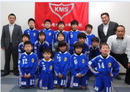
PASEKORTO ユニフォーム 授与式 3月20日

ジュニアサッカーチームPASEKORTOへKMS,MNSより、ユニフォームの贈呈を行いました。