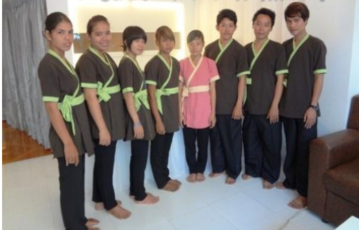
コンシェルジェを中心に現地スタッフ

メコンデルタエリアの中核として今後大きな発展が期待されているカンボジア。国民の平均年齢23歳、いまアジアの中で最も若く熱い国である。