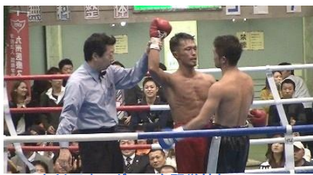
九州医療スポーツ専門学校杯 Vol.5