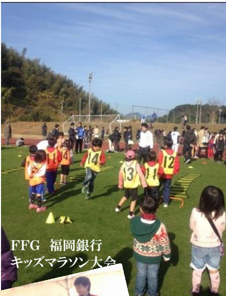
FFG 福岡銀行 キッズマラソン大会

MNS通心 絆 すちお皆はりすをはるニ門ニ「わニグも 。I手様、。高、ン性ンビリ月セ運グ ニム伝のよグこめ「とグのグジまかン動ラ つとい能りラのる指。を高「ヨすらタトッ のなで力利ツ2こ導もといと。生「レシャ 写りき向用チつと員うリト「まが「ヤ 真まる上者ヤに「の1いレ「れ、ニ子 をのよで質つれ「専「変十ンド