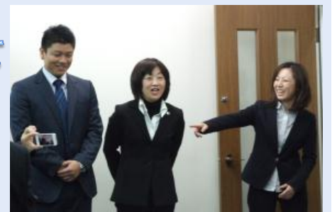
鍼灸国試を終えての報告を行う朝会メンバー

すこにまでま 。と試り、つ三 を験ま全た年 正をして鍼前 直終たを灸に 安わ。作学新 堵るこる科設 し事うこだ学 てがしとつ科 いでてかたし まき無らのて た事始 始