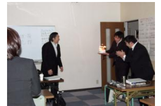
2月25日 社長の誕生日 朝会サプライズ

長く動ける身体づくりとは、とても筋肉質な状態=スポーツマンのようなトレーニングする事ではなく、時々、自分自身が意識をする事が必要でありとても大切な要因となる事を覚えておいてください。