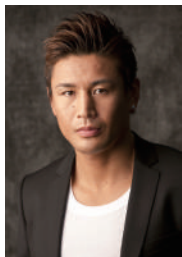
↑ 第5回シンポジウムの様子と今回のゲスト魔装斗さん